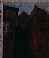
Sopra e in basso alcune immagini di Palazzo Chigi Albani a Soriano